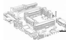
臺中市立臺中第一高級中等學校 105 學年度第 2 學期學雜費及代收代辦費收費標準表