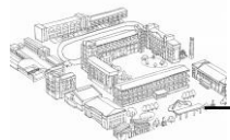
國立臺中第一高級中學 105 學年度第 1 學期學雜費及代收代辦費收費標準表